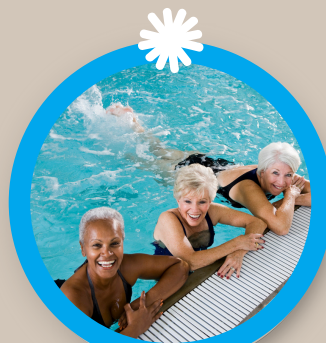
Séance pour adulte