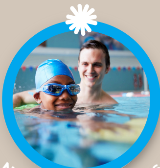
Natation pour enfants